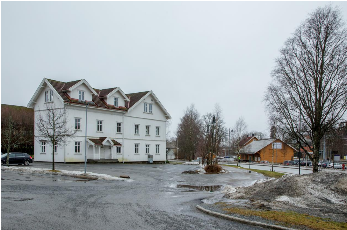
Under: Det gamle herredshuset i Spydeberg ligger side om side med jernbanestasjonen. (LHR)