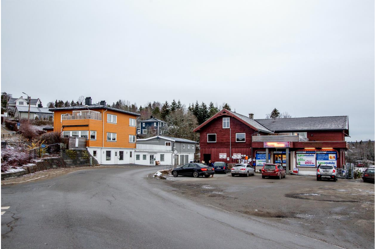
Over: Sjarmerende stilblanding i Tomter sentrum. (LHR)