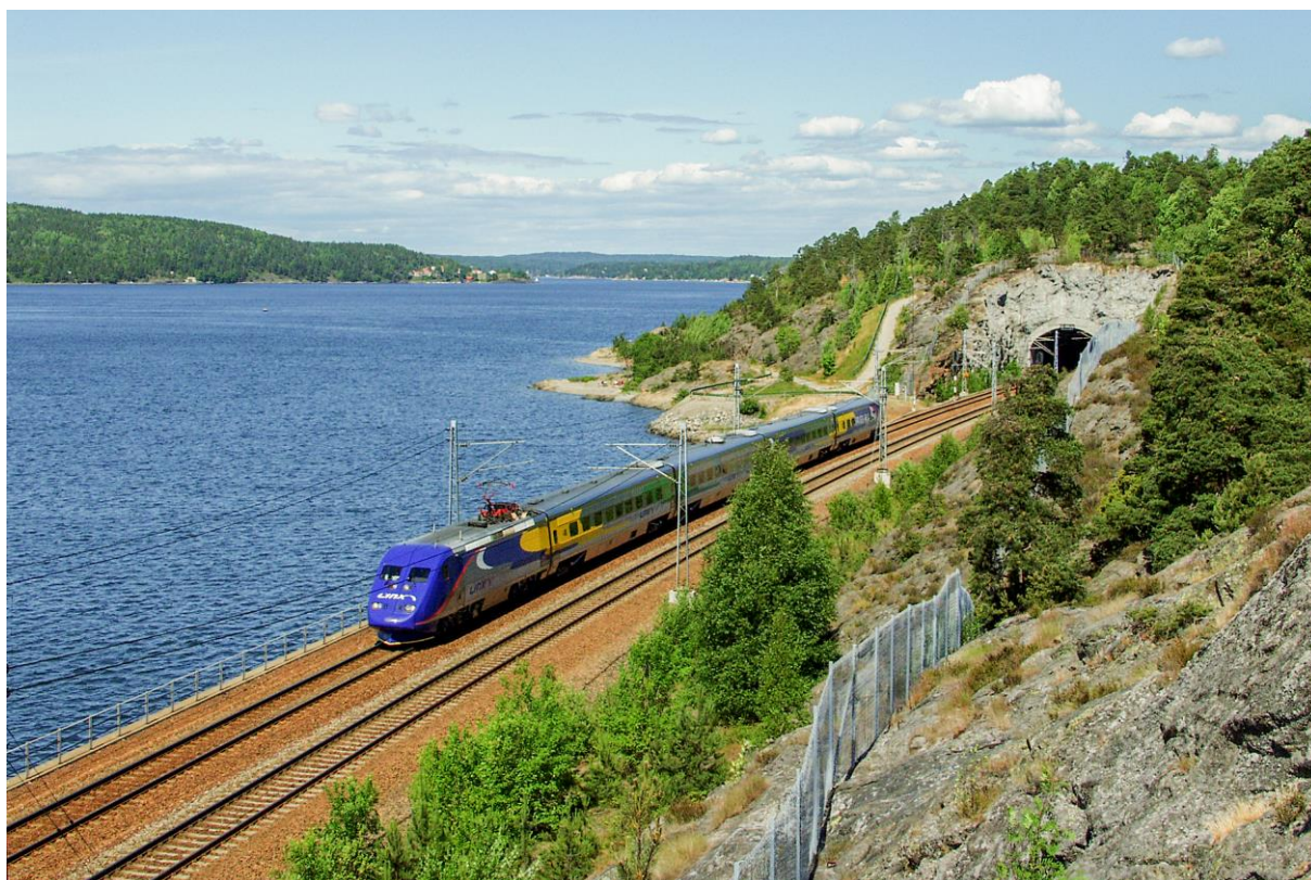
LINX Oslo-Göteborg nord for Moss 17. juni 2004. (LHR)

Organ for Norsk Jernbaneklubb Lokalavdeling Østfoldbanen