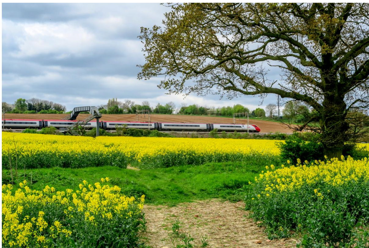
Et Virgin Pendolino-sett vest for Northampton 16.04.2017.

Organ for Norsk Jernbaneklubb Lokalavdeling Østfoldbanen