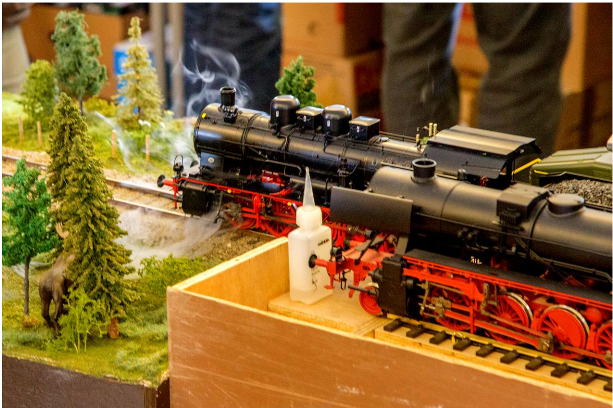
Under: Realistisk røykutvikling. (LHR)