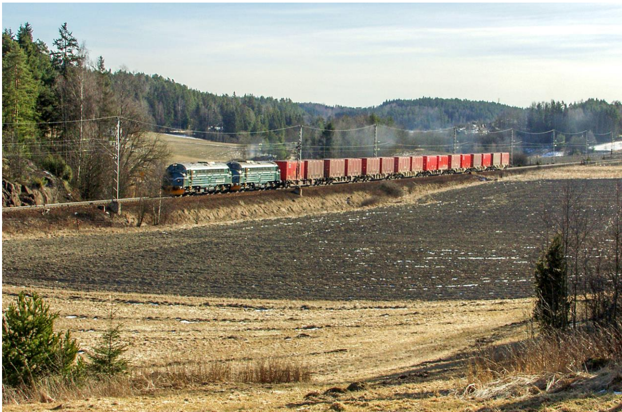
Diesel under kjøretråd nord for Onsøy 9. mars 2005.

Organ for Norsk Jernbaneklubb Lokalavdeling Østfoldbanen