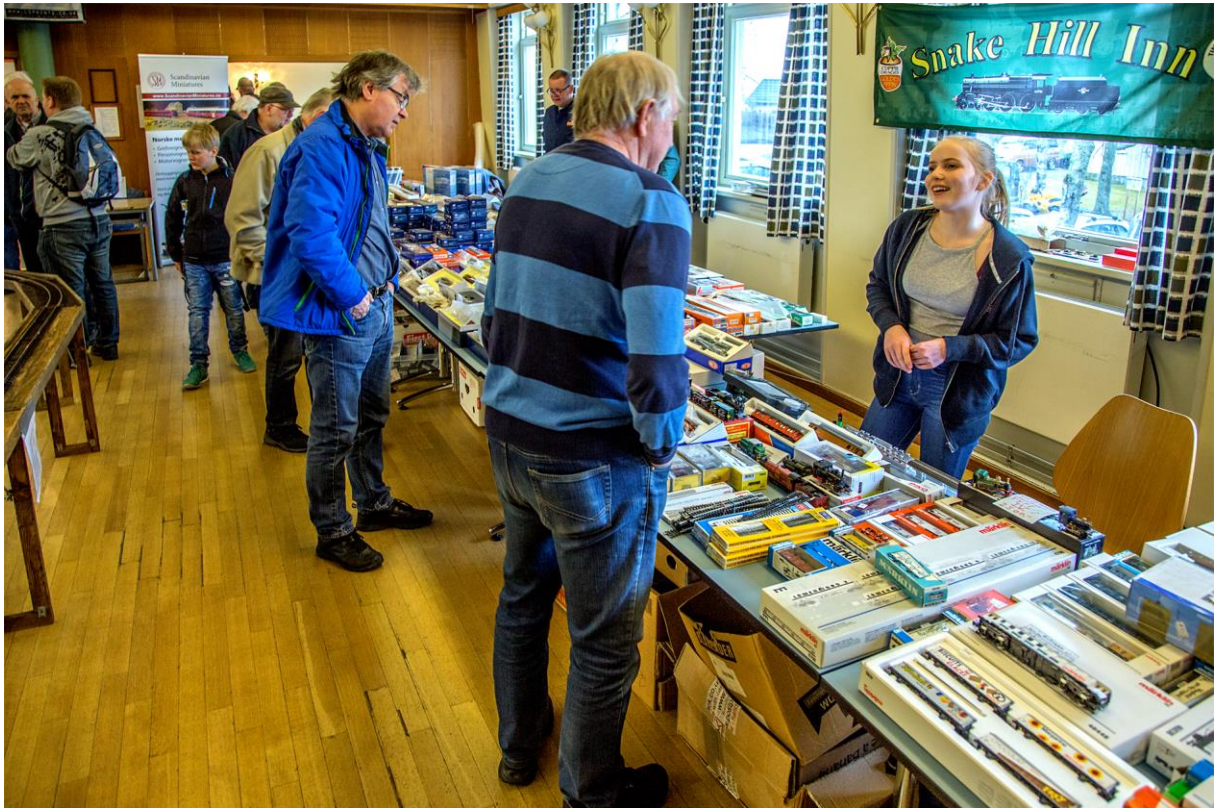
Over: Munter passiar over salgsgjenstandene. (LHR)