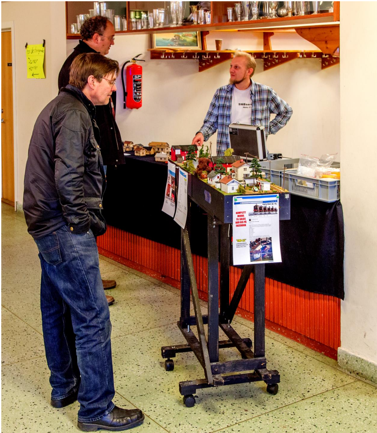
Fra avdelingen for husbyggere i liten skala. (LHR)

Husk å holde av helgen 18. – 19. mars! Det er igjen tid for den årlige MJ-messen i Kråkstad Samfunns- hus, og vi trenger frivillige til billettsalg, stand og kjøkkenarbeid. Som vanlig frister vi med et lite knippe bilder slik at du vet hva som venter deg disse to dagene. Vel møtt!