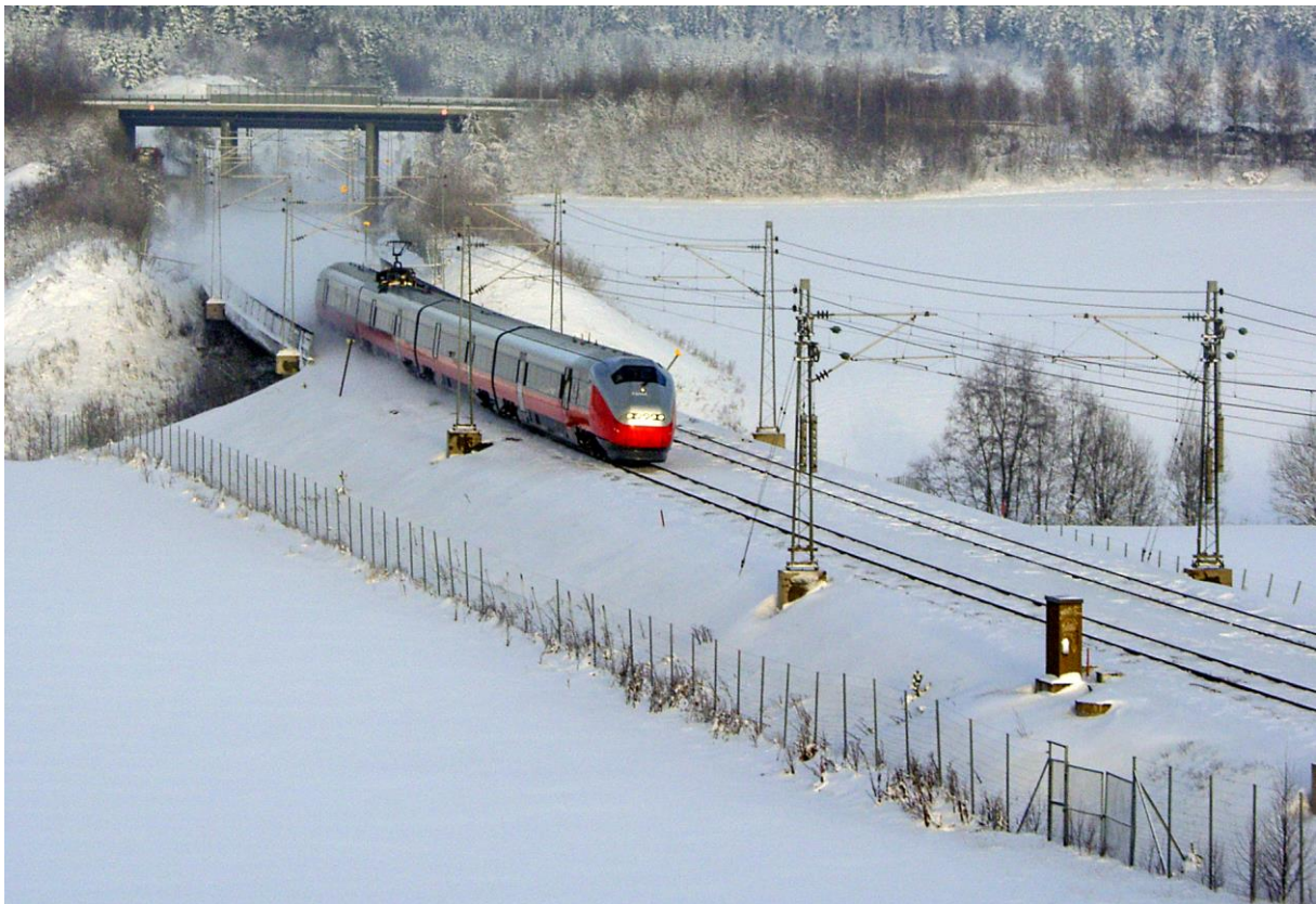
Sørgående intercity-tog mellom Ski og Ås 29.11.2004.

Organ for Norsk Jernbaneklubb Lokalavdeling Østfoldbanen