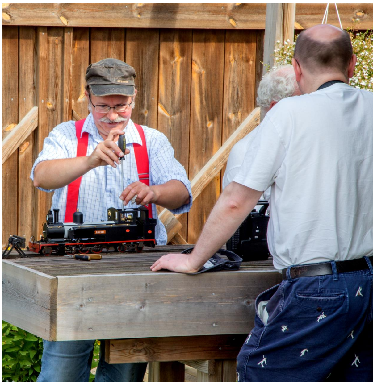
Artikkelforfatteren i nitid konsentrasjon under en meget lokal sammenkomst i juni 2014. (LHR)

lig og realistisk form for «smussing», oppnådd helt uten arbeidsinnsats fra modellbyggeren. Taket har ingen synlige merker etter vær og vind. Det oppstår så godt som aldri dugg på vinduene, i motsetning til stasjonsbygningen som er plassert like ved. Jeg antar dette skyldes at rommet innenfor vinduene ikke er så tett som stasjonsbygningen, finerplatene regulerer nok også fuktighet bedre enn pleksiglass. Alt i alt synes jeg modellen har klart seg bra utendørs gjennom disse årene, det samme har vognene som har stått inne i den.