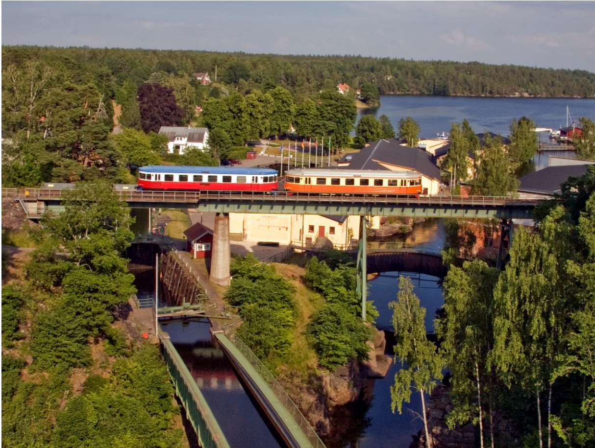
Chartertog på Håverud viadukt 30.06.2009

I hvert fall hvis oppslutningen blir stor nok. NJK Østfoldbanen inviterer til tur til Dal Västra Värmlands Järnväg (DVVJ) i Sverige, og planlagt dato er lørdag 27. august med Kråkstad som utgangspunkt. Avgang er kl. 9.30, og vi planlegger å leie buss til formålet.