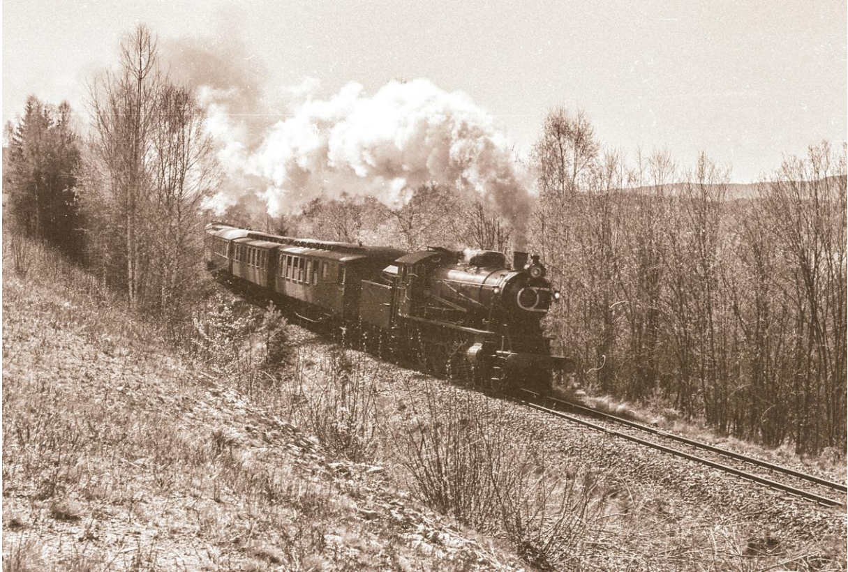
En dobbel dose nostalgi fra mer enn 20 år tilbake – dampkjøring med 30a.271 i Solør våren 1990 (over) og Di3.631 under rangering på Trondheim stasjon sommeren 1994 (under).