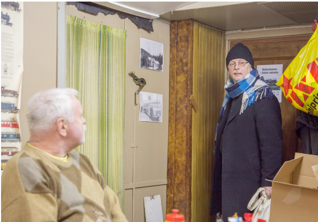
Kassereren ser innom Den Røde Baron