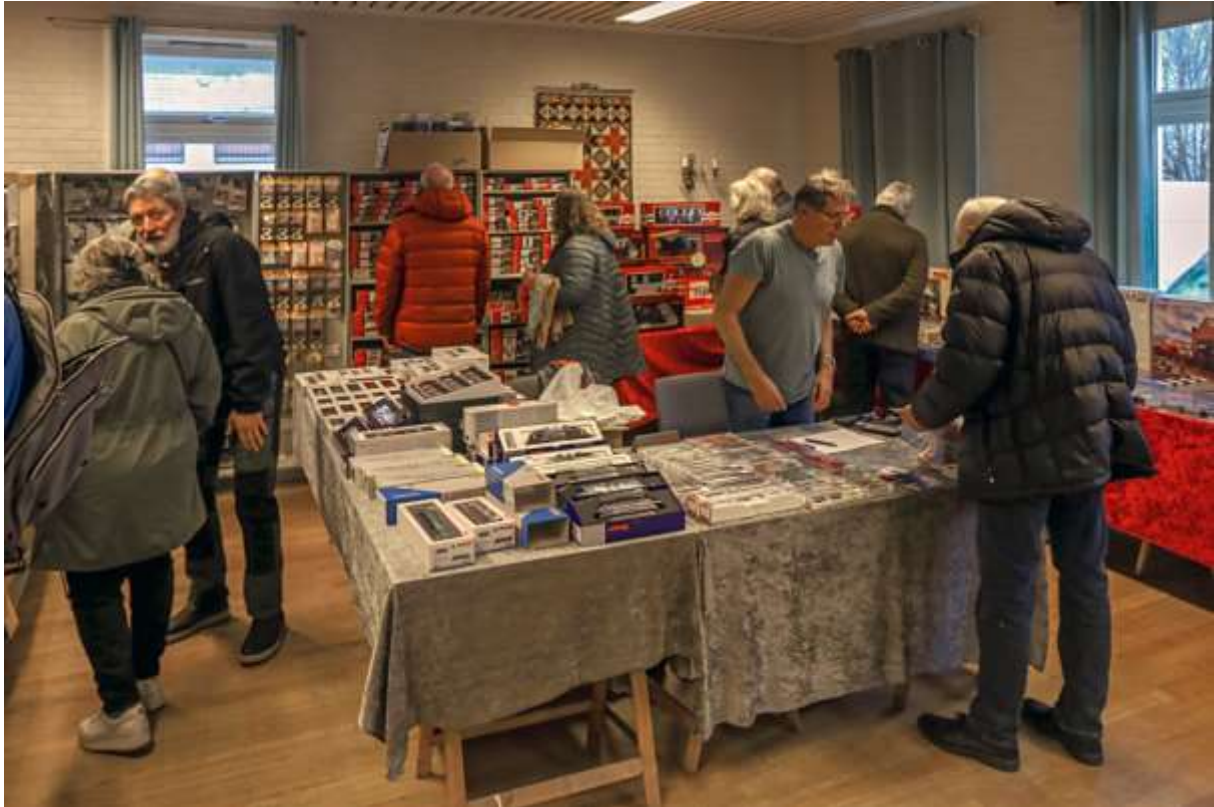
Over: Ivrige MJ-kunder i Bøndernes hus i Råde 2. mars 2024. (LHR)