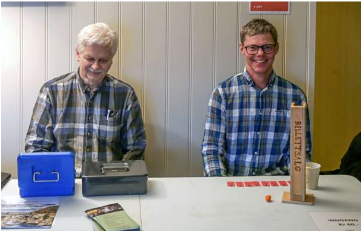
Under: To generasjoner Sand bemanner billettsalget under MJ-messen i Råde. (LHR)