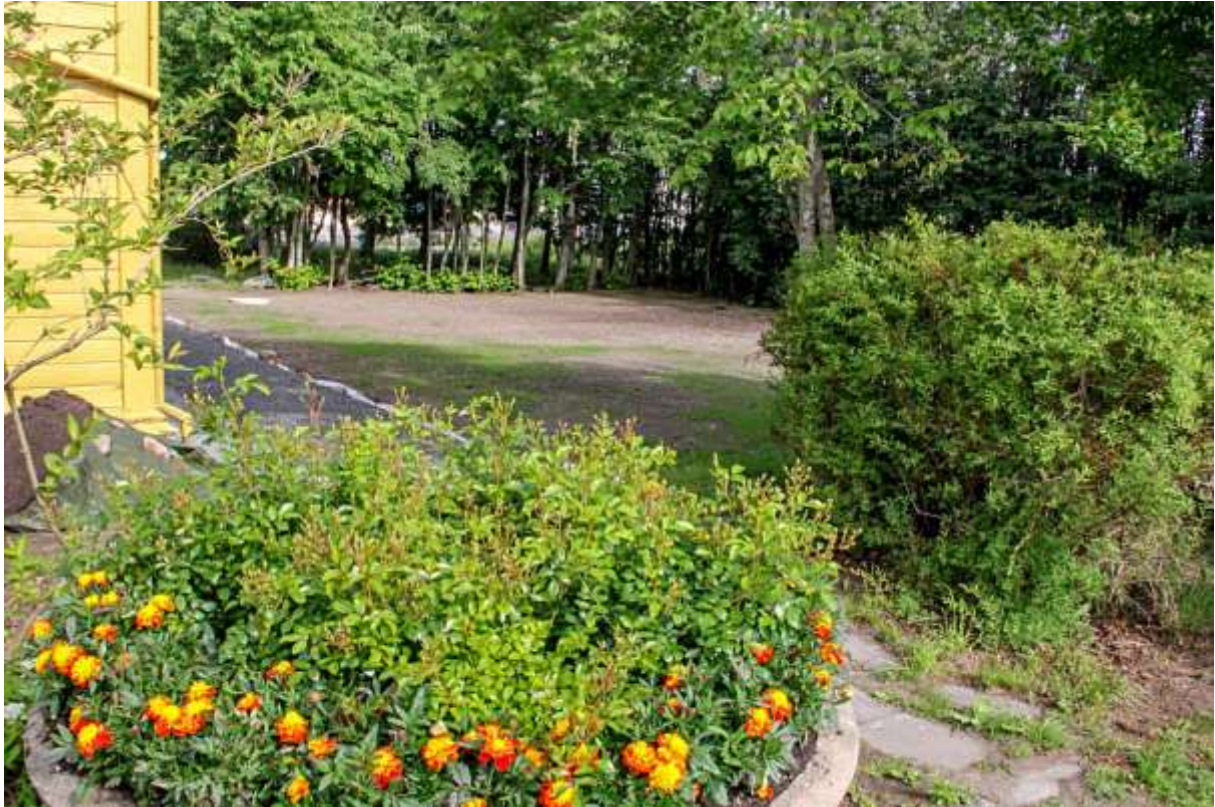
Utearealene fikk et skikkelig løft våren 2024, med både god beplantning og ny grusgang fra parkeringsplassen til inngangspartiet. (Gylmer Bach)