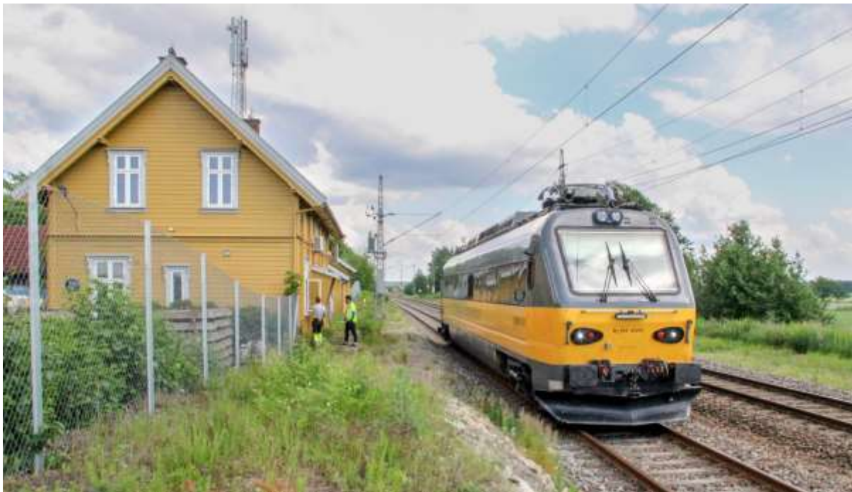
En studie i gult, Dilling 31.05.2024.