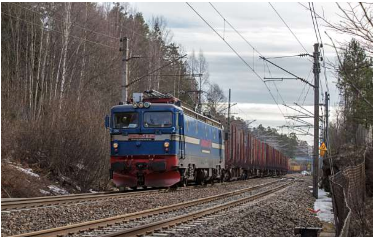
Grenland Rail 5352 ved Holmlia en marsdag i 2024.

Juleavslutning med standard program og servering av kake og kaffe/te.