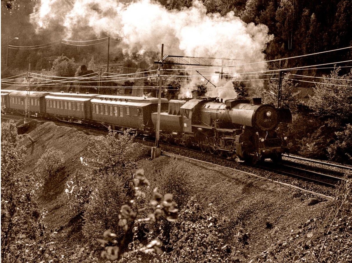
Skikkelig dampekspress i Liadalen nord for Hauketo. (LHR)

Det ble nok forbigått i stillhet i mai måned, men 23. mai 2019 var det altså 20 år siden NJK lokalavdeling Østfoldbanen i samarbeid med Norsk Museumstog sto for et av de største arrangementene i lokalavdelingens historie.