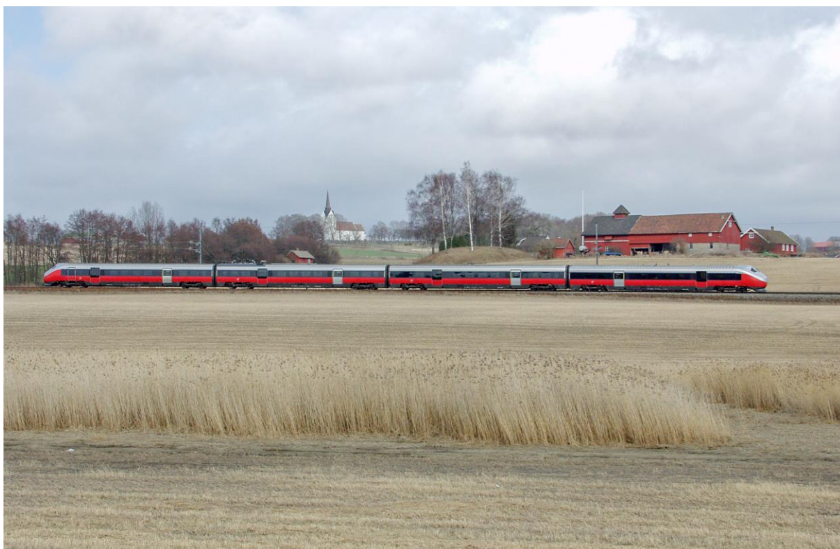
Under: Type 73B like sør for Råde 5. april 2005. (LHR)