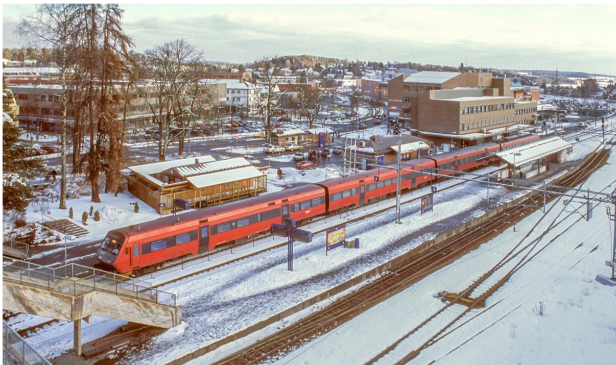
Over: Type 70 på Ski stasjon en februardag i 1998. (LHR)

Oslo-Halden (137 kilometer), og brukerne tok naturligvis i mot de nye togsettene med åpne armer. Og der er vi faktisk ennå – 16 år etter at type 73B ble introdusert!