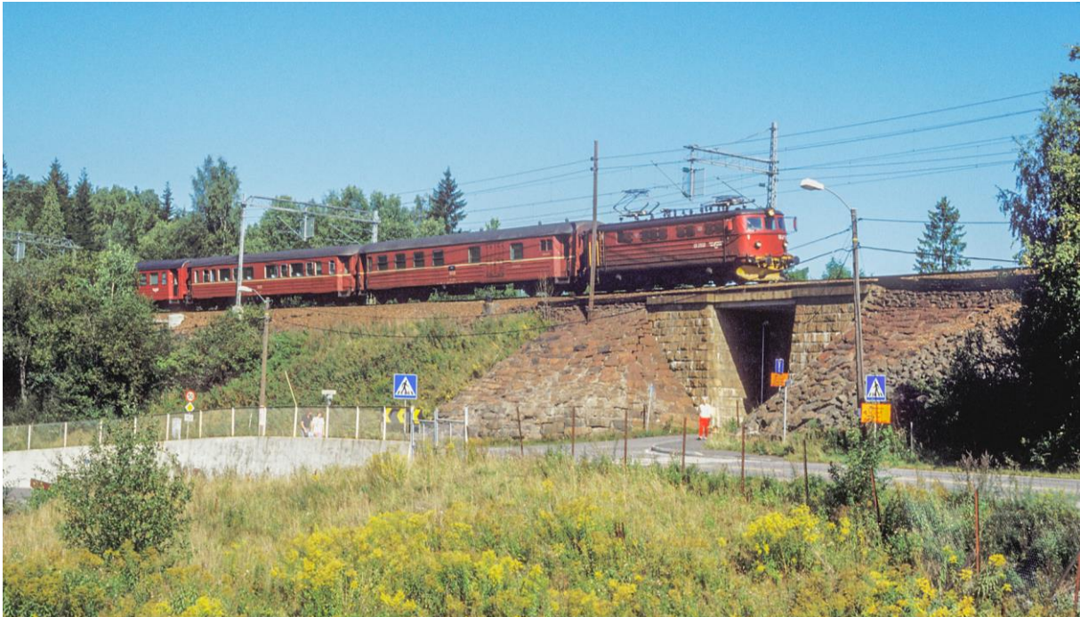
Et klassisk intercitytog anno 1991 passerer den gamle undergangen ved Greverud skole. (LHR)

Tilbudet ble godt mottatt, og med avganger annen hver time ble plutselig togdekningen drastisk bedre sør for Moss. Vi må også huske på at strekningen Oslo-Halden er temmelig kort sammenliknet med intercitystrekninger på kontinentet: Til sammenlikning er det lengre fra Hamburg til München enn fra Trondheim til Bodø.