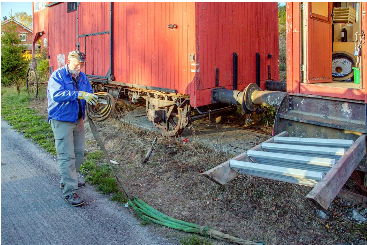
Under: «Baronen» har tilbakelagt en respektabel distanse tatt i betraktning at vi kun hadde brødmotor til rådighet.