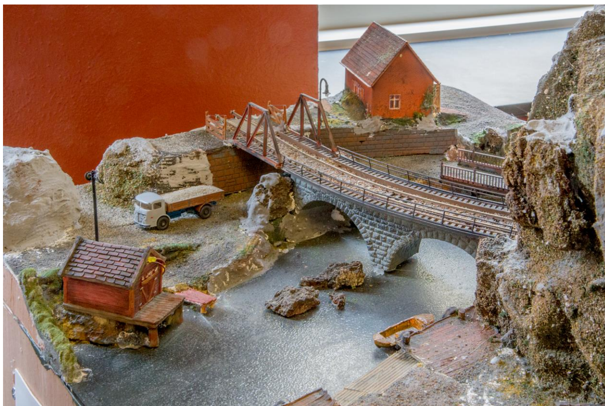
Under: Tore Christiansen stiller definitivt i en egen klasse som landskapsbygger. (LHR)