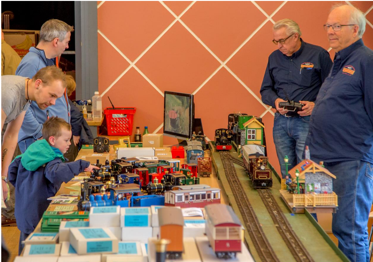
Over: Stor spredning i alderen blant livesteam-entusiastene. (LHR)