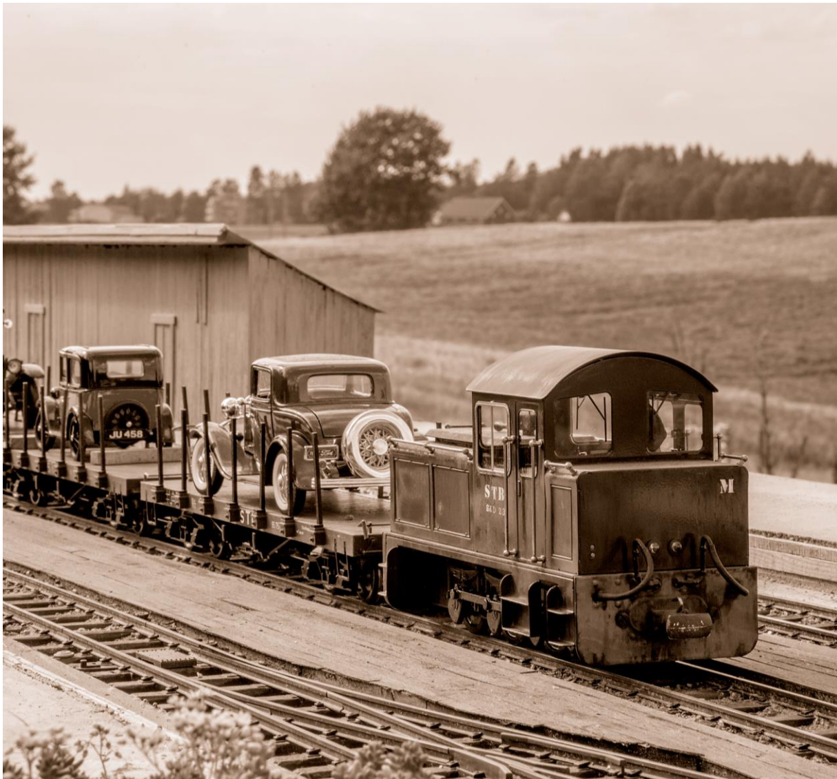
Biltransport som i gamle dager. (LHR)

Men det viktigste er vel til syvende og sist å velge den sporvidden du liker best, og å føre sporviddestriden videre i liten skala.