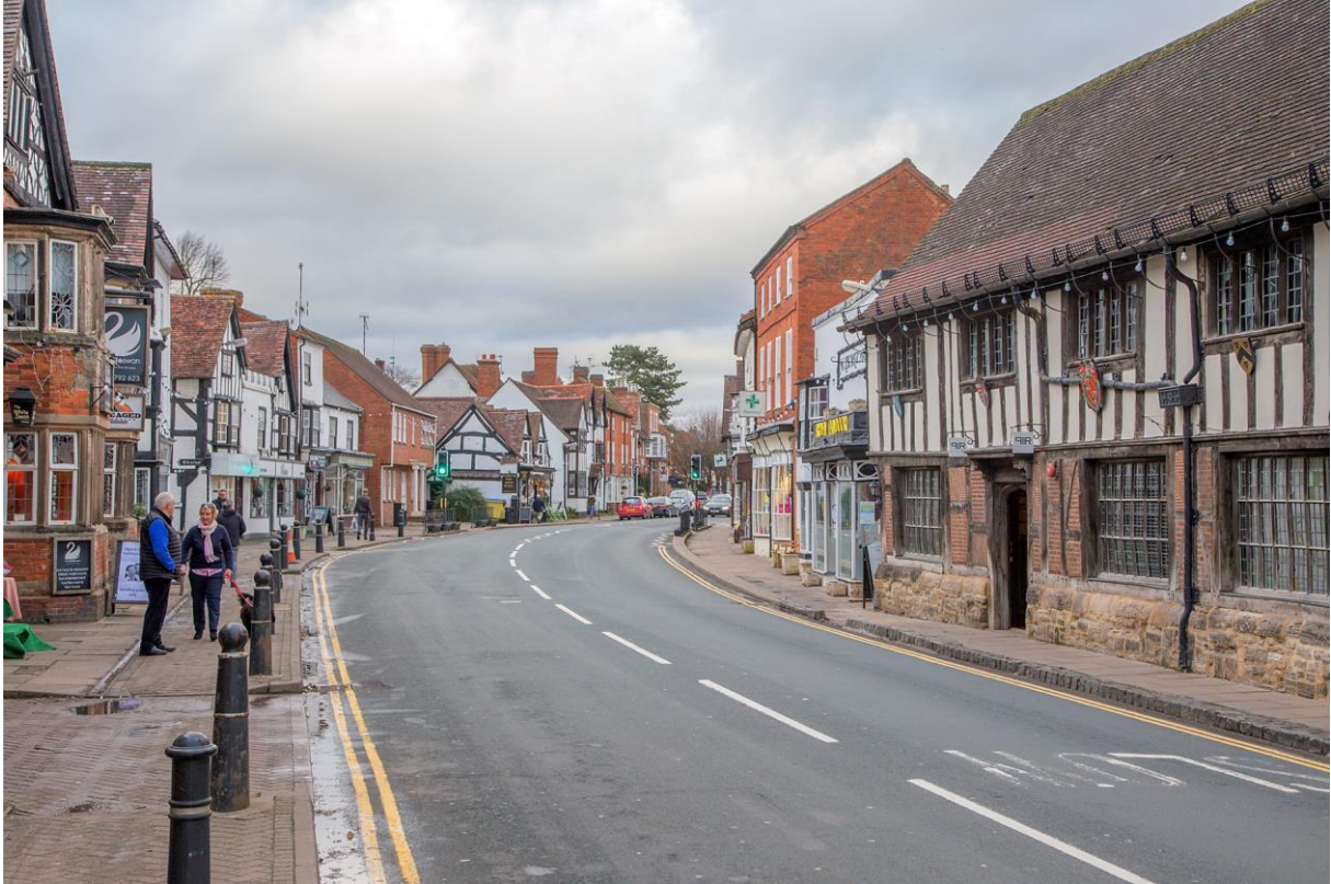
Over: Henley-in-Arden: det ultimate stedet for afternoon tea. (LHR)