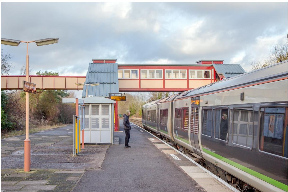
Under: Forblåst, og ikke akkurat folksomt på stasjonen i Henley-in-Arden. (LHR)