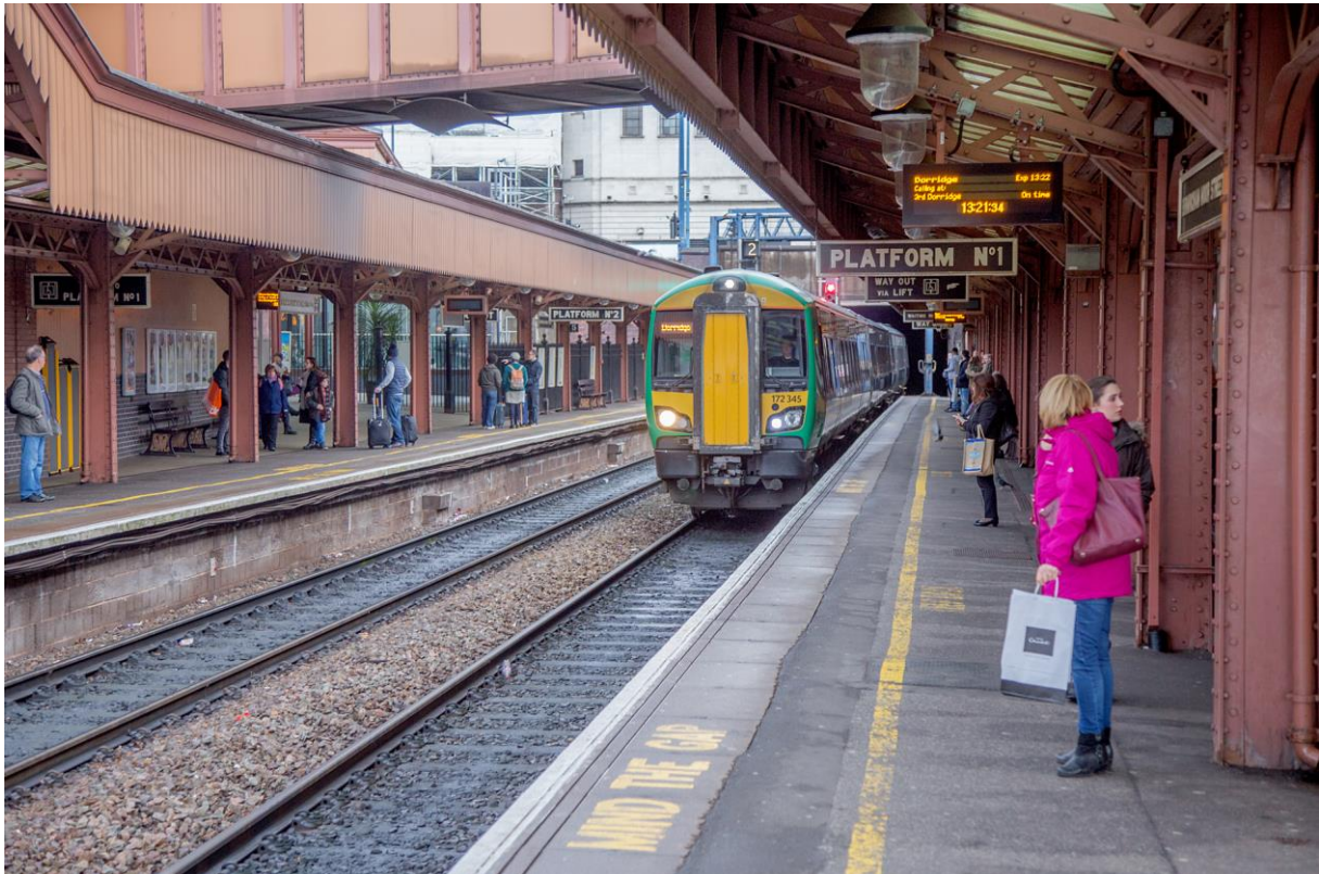
Birmingham Moor Street 04.01.2018. Etter lokaltoget til Dorridge kommer avgangen til Henley og Stratford-upon-Avon.

Hun avleverte meg som vanlig på jernbanestasjonen i Northampton, og jeg lot blikket gli over det store jernbanekartet på veggen i stasjonshallen.