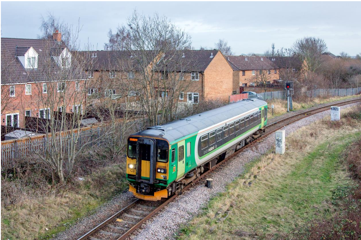
En skinnebuss av type 153 nærmer seg Bedford. Banelegemet røper også at denne linjen ikke er bygd for framføring av tunge tog. (LHR)

I dag foregår trafikken mellom Bletchley og Bedford med motorvognsett av type 150 og skinnebusser av type 153. Sistnevnte er trofaste slitere på mange av Englands mindre trafikkerte linjer, men kan ikke akkurat sies å være stillegående. Uansett – besøker du de landlige delene av England, så er det en god mulighet for at det er en sidelinje i nærheten hvor du kan støte på materiell som er lysår unna det vi forbinder med hovedlinjene!