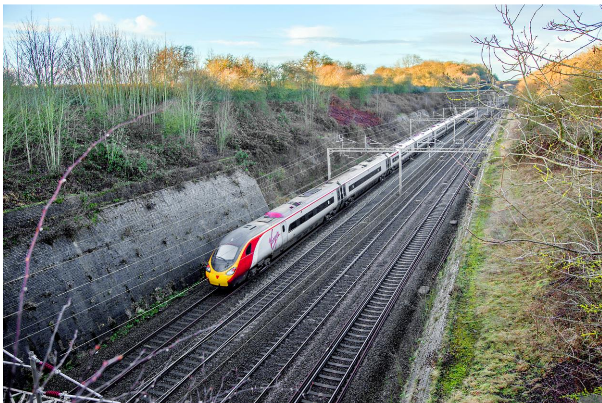
Nyttårstoget! Virgin på vei mot Skottland 01.01.2018.

Organ for Norsk Jernbaneklubb Lokalavdeling Østfoldbanen