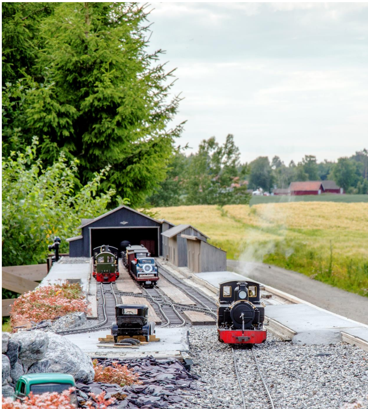
Frodig kulturlandskap og live steam – et harmonisk hele. (LHR)

nendørs i en bølge med vann hver vinter. Fossefallet medfører dermed litt ekstra arbeid, men det er det verdt. En foss er tross alt en enkel måte å skape litt liv i anlegget på. Kanskje dukker det også opp amfibier i dammen som kan representere en skalariktig alligatorbestand i vannet og i strandkanten.