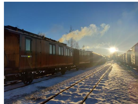
Juletog med fyr i ovnene.

De som sto for det hele var i tillegg til NJK driftsgruppen Krøderen velforening og Buskerudmuseet.