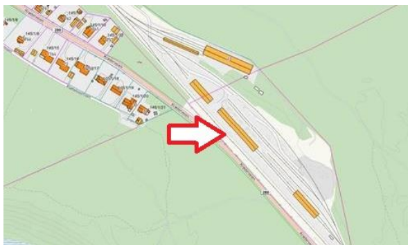
Skisse over Kløftefoss området med pil rettet mot aktuell byggeplass på de to eksisterende spor mellom godsvognhallen og verkstedet.

Vi ønsker å bygge en 80 m lang hall med to spor mellom godsvognhallen og verkstedet. Plasseringen vist på figuren er omtrentlig ettersom det nok er greit å få lengere avstand mellom verksted og hallen. Grunnen er forberedt for bygging for mange år siden.