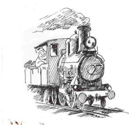
Tegning: Geir Helgen

Ansvarlig redaktør: Henrik B. Backer Dagfinn Lunner, redaktør e-post: dagfinn.lunner@tertitten.com Tlf.: 99 52 74 50