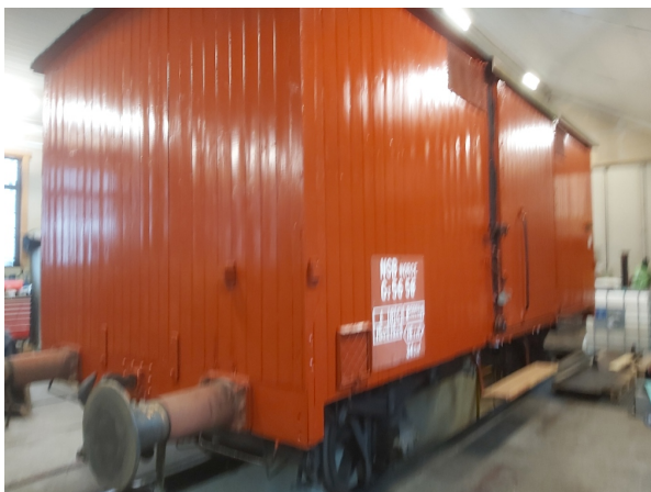
G3 5658 inne i verkstedet på Kløtgefoss