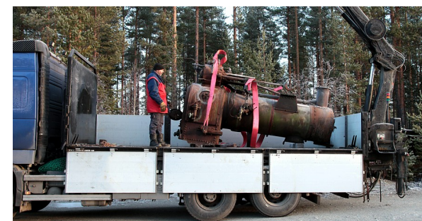
Lokomobilens kjele.

For mange år siden ble det anskaffet en lokomobil til Krøderbanen. Den hadde i sin tid stått på et sagbruk på Letmoli i Sigdal, og meningen var at den skulle settes i stand slik at den kunne demonstreres ved spesielle anledninger. Av forskjellige grunner har dette ikke latt seg gjennomføre, og lokomobilen har stått lagret under en presenning på en godsvogn på Kløtgefoss.