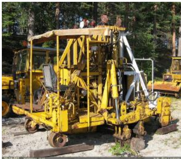
Svillebyttmaskinen Krøderbanen overtok fra NSB i 1998. Bilde fra Kløftefoss.