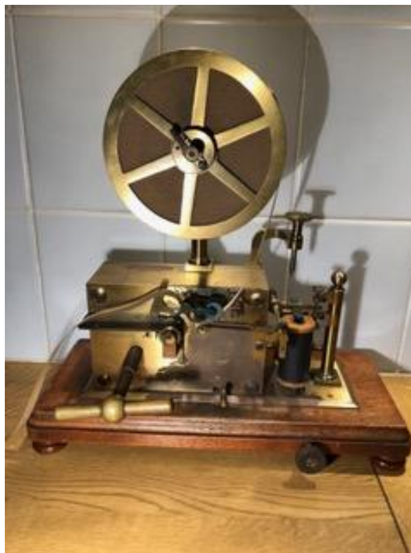
Bilde: Nyanskaffet telegrafapparat, merket DNRT nr. 85.

Krøderbanen mangler kompetanse på telegrafapparater.