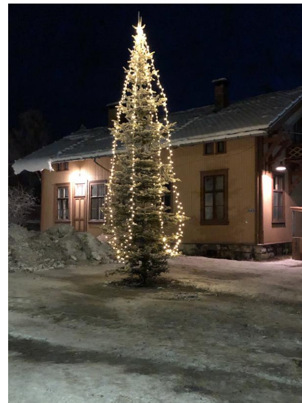
Juletregranen er tent på Krøderen stasjon. Foto: 1. desember 2019

KrøderbaneNytt ønsker alle sine lesere God jul og Godt nyttår