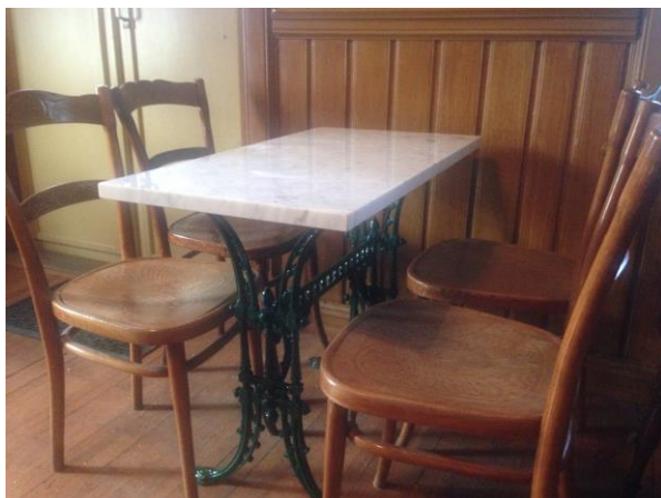
Nye cafebord på Krøderen st.

Det gjenstår å invitere de som har betalt for marmorplatene, Venneforeningen Krøderbanen, på kaffe og kake.